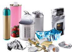
Emballages métalliques y compris les petits