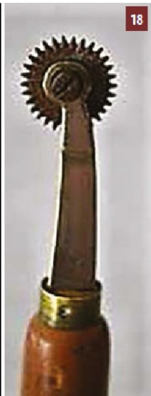
Roulette de cordonnier