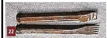
Gradines de tailleur de pierres