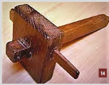
Trusquin de menuisier