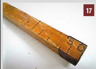
Mètre de tailleur