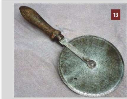
Gabarit de charron