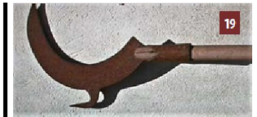
Voûge de cultivateur