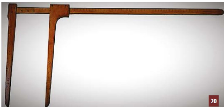
Compas de marchand de bois ou de forestier