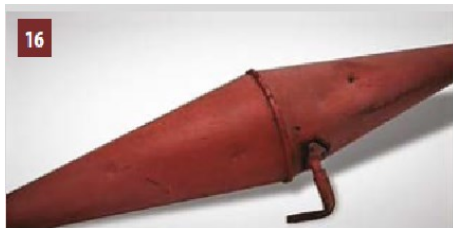
Carotte (emblème) du buraliste