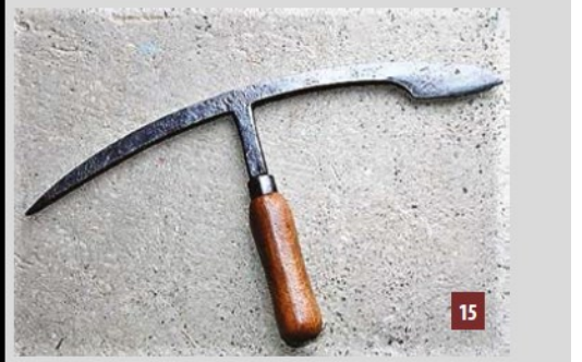
Bisaigüe de charpentier - couvreur