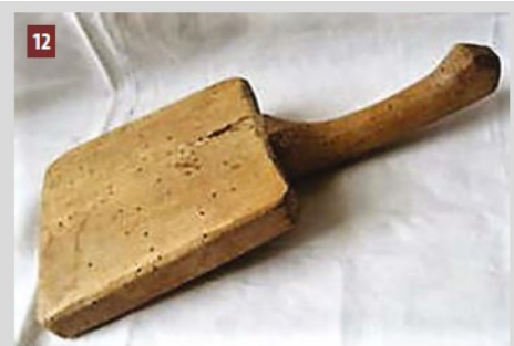
Forme à chapeau de modiste