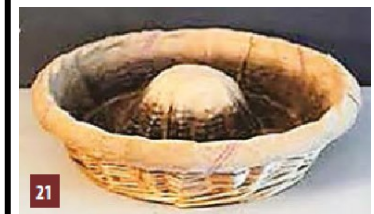
Baneton de boulangier